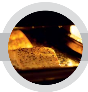
Delikátní rybí filet s přirozenou chutí