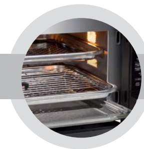
27litrová nízkoúdržbová varná komora z nerezové oceli