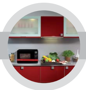
Prostorově úsporná koncepce 3 v 1