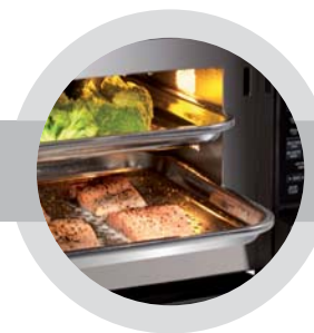
Kompletní jídlo až pro čtyři lidi v jediném kroku

Stejně šetrně parní hrnec zachází i s vitaminy a živinami v jídle. Zvláštní parní generátor generuje čistou páru bez použití mikrovln, teplotu lze zvolit v rozmezí od 70°C do 100°C. V tomto rozmezí teplot lze jídlo připravovat zvláště šetrně. Minerální látky, stopové prvky a například vitamin C jsou tímto způsobem ideálně chráněny a v ingrediencích zůstávají v mnohem vyšších koncentracích v porovnání s tradičním způsobem tepelné úpravy. Brokolice připravená v parním hrnci obsahuje cca o 50 % více vitamínu C než vařená brokolice. Masité sladké papriky připravené v parním hrnci dokonce obsahují stejné množství minerálních látek, jako syrové papriky.***